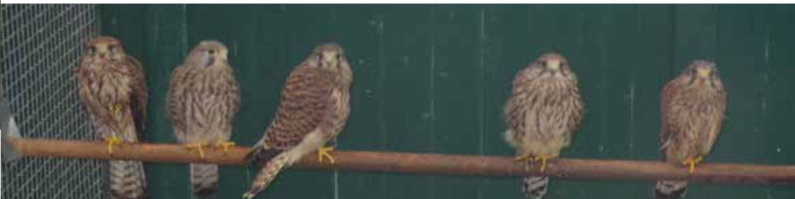
5 jonge torenvalken in de opvang

Juli is de maand dat we hele nesten tegelijk krijgen doordat de jongen hun moeder zijn kwijtgeraakt. Het gaat vaak met 5 of meer tegelijk wat ons weer handen vol met werk geeft doordat elk dier weer ander soort voedsel nodig heeft. Zo kregen we 5 jonge torenvalken die om verschillende redenen waren binnen gebracht.